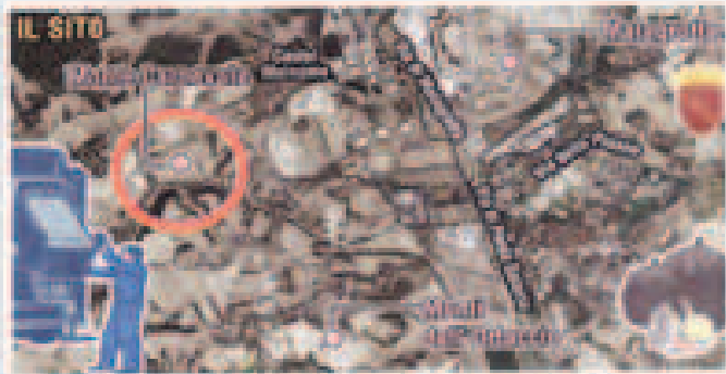
A sinistra, la discarica di Malagrotta. In alto a destra, il sito di Monte Carnevale. In basso a destra, il sito di Quadro Alto. In basso a sinistra, il sito di Pian dell'Olmo.

"Il quadrante di Malagrotta non può essere più toccato. Per ragioni tecniche, ma anche per ragioni di giustizia nei confronti di questi cittadini". Gianni Alemanno ieri pomeriggio è andato a Ponte Galeria a dire a qualsiasi ipotesi, per la discarica, che ricada nella zona di Malagrotta: no a Monte Carnevale, no a Monti dell'Ortaccio. Sindaco ma allora qual'è il sito giusto? "Il sito perfetto non esiste, questo Clini deve capirlo. Ma sicuramente Quadro Alto e Pian dell'Olmo sono meno peggio di qualsiasi area della zona di Malagrotta". Nell'assemblea con i cittadini di Ponte Galeria Alemanno ha detto: "Sono pronto a mettermi la fascia tricolore e scendere in strada a protestare insieme a voi". Da dieci giorni il Ministero dell'Ambiente, insieme ai tecnici degli altri